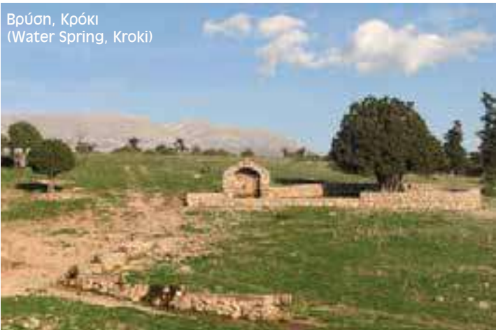
Βρύση, Κρόκι (Water Spring, Kroki)

The "Skala" is in front of us for some smooth and nice zig zaged climbing over the City of Delphi that will lead us straight to the summer camp settlement of "Kroki" with the traditional drinking water fountain that will quench our thirst and supply us with fresh water once more. After the brake we follow the E4 sign to the north and into the National Forest of Parnassos Mt. The course, apart from the E4 signs, is also "assisted" by the water pipeline that runs through the pathway. On our climb we will meet the rural road several times until we finally reach the fantastic "Kalania" plateau where the